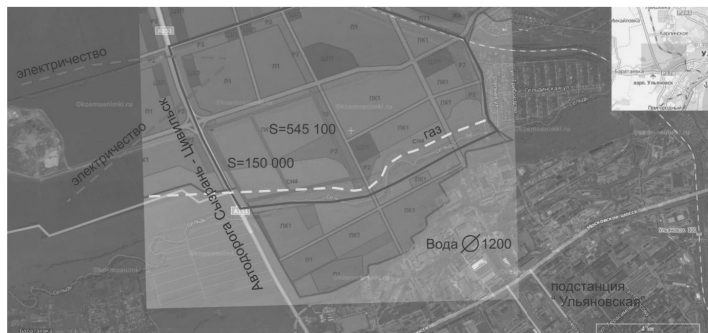
«Схема размещения промышленной зоны «Карлинская»

ж) дополнить приложением № 6 следующего содержания: